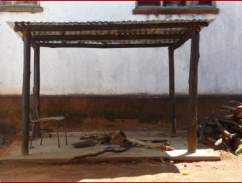
Overdekte kookplaats bij studenten (vrouwen) hostel