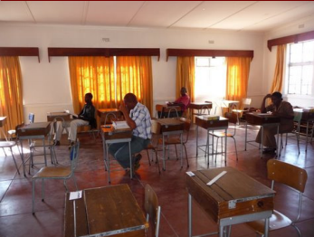
Examen lokaal MThC