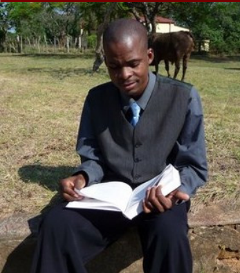
Student bezig met voorbereiding van examens