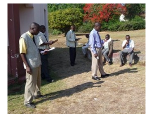
Studenten buiten bezig met voorbereiding