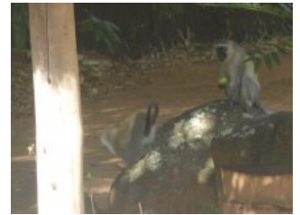
De bewuste apen