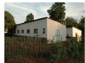
Studenten (mannen) hostel