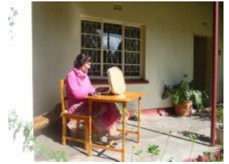
Omdat het koud was in huis, werkt de 'typiste' buiten